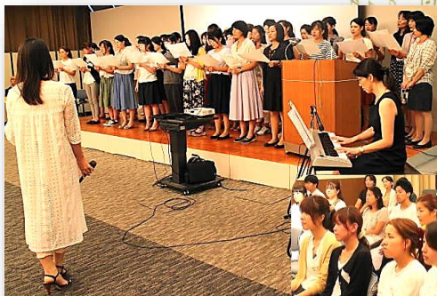
お互いの歌を聴き合うと、 いろいろなことに気づきます。