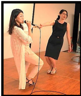
それでは、発声練習開始！ 頭声発声を美しい声で出 しましょう！

正しい発声の仕方を学び、保育現場に生かしていきましょう！ 歌唱指導のポイントやパートに分かれて歌うことの楽しさを味わいましょう！ 二人組になって引っ張りっこしたり、しゃがんだり。まず体を動かしましょう！